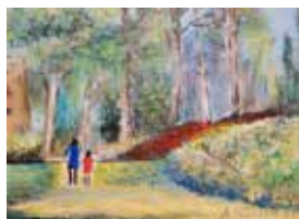
Spaziergang, Mischtechnik, 13x18 cm