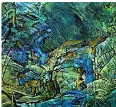
Hinein-Seh-Bild Mischtechnik, 60x60 cm, 2016

Titel der Ausstellung: «Hinein-Seh-Bilder»