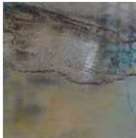
Acryl-Mischtechnik, 80x80 cm, 2016