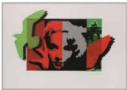
Inkjetdruck auf Büttenpapier, Auflage 20 Stück, 70x100 cm, gerahmt

«FROM EXIT TO EXIT», Kultur im Bahnhof St. Gallen; Ausstellung im Haus für Kultur, Schwellbrunn; Verschiedene Gruppenausstellungen im In- und Ausland