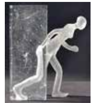
Skulptur Glas, 15x20 cm