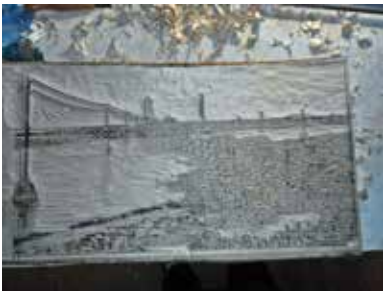
Holzstock in Arbeit, Hafen von Reykjavik

Titel Ausstellung: «Irgendwo auf Island»