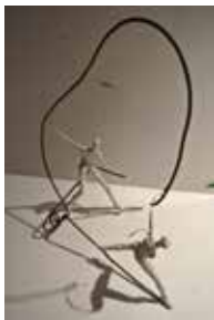
Die Drahtzieherinnen Mischtechnik, Eisen, 2015

Teilnahme an verschiedenen Einzel- und Gruppenausstellungen Verschiedene Auftragsarbeiten und Kunst am Bau