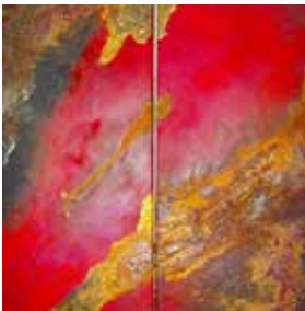
Acryl-Rost, 2-teilig, 80x80 cm, 2013