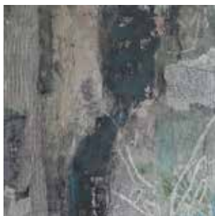
symbiose, 2015 mixed media auf Stoff 80/80 cm