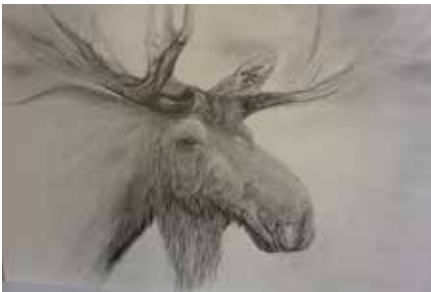
Bleistift, 51x60 cm, 2015

Gemeinschaftsausstellung Thema: «Tierisch»