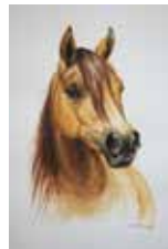
Pferd, Aquarell, 8 x 12 cm, 2000