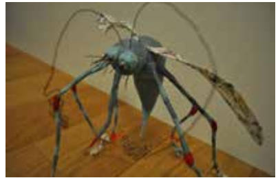
Mücke «Mike», Pappmaché ca. 25x30 cm

Gemeinschaftsausstellung 3. bis 7. März 2017