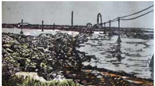
Japanischer Holzschnitt vom Hafen von Reykjavik ca. 50x29 cm