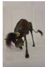
Stier Pappmaché, ca. 20x10 cm

Gemeinschaftsausstellung 3. bis 7. März 2017