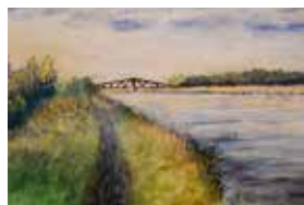
Am Rhein, Mischtechnik, 13x18 cm

Titel Gemeinschaftsausstellung: «Harmonische Gegensätze»