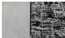
zwischenenspiel mixed media auf Holz 2-teilig 42/42 cm, 30/42 cm