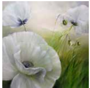
Weisser Mohn II: Öl auf Leinwand, 100x100 cm