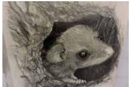
Bleistift, 51x60 cm, 2016

Gemeinschaftsausstellung 3. bis 7. März 2017