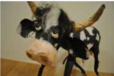
Kuh «Carla», Pappmaché ca. 35x45 cm

Gemeinschaftsausstellung Thema: «Tierisch»