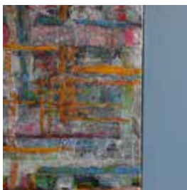
frühtau mixed media auf Stoff 2teilig 50/70, 20/70 cm