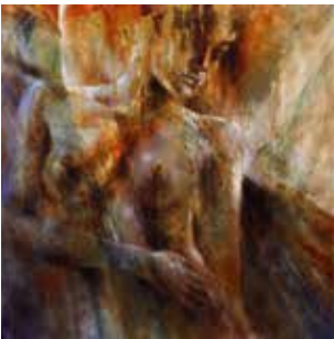
Karla V: Öl und Acryl auf Leinwand, 100x100 cm

Rege Ausstellungstätigkeit seit dem Jahr 2000, überwiegend im süddeutschen Raum.