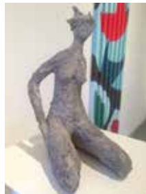
Die Schöne Zement Mörtel, 2015