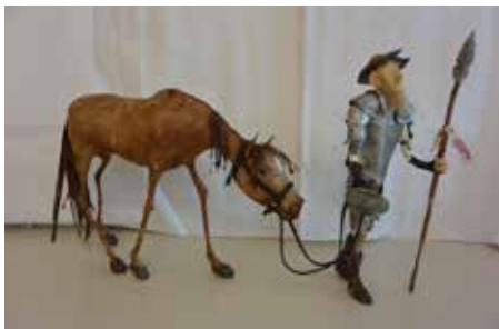
Don Quichotte mit Rosinante Pappmaché, Gesamt ca. 40 x 20 cm

Gemeinschaftsausstellung Thema: «Tierisch»