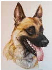
„Django“, Aquarell, 18 x 24 cm, 2016

Titel Gemeinschaftsausstellung: «Harmonische Gegensätze»