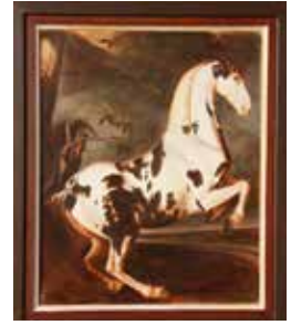
Eisgruber-Schegg, 74x61 cm