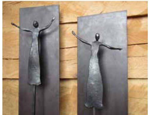
Engel, Stahl, roh geschmiedet, 150 cm