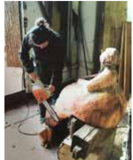
An der Arbeit