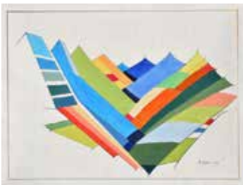
Faltberge, 60x70 cm, Öl

Titel der Ausstellung: «Graubünden/Farbbünden»