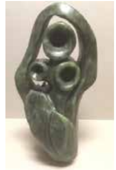
Blumen, 2018, Höhe 43 cm