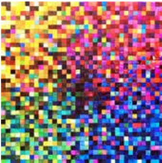
Sommerwelt 100x100 cm

Zahlreiche Ausstellungen im In- und Ausland