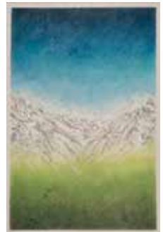
Val Schaia, 50x70 cm Pastellkreide/Bleistift