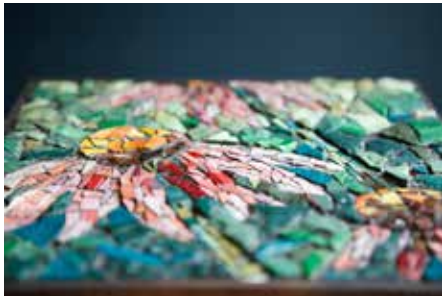
Tisch «Echinacea», Glassmalten und Metall 30x30x58 cm

Titel der Gemeinschaftsausstellung: «Mosaik, Acrylmalerei und Tuschezeichnung»