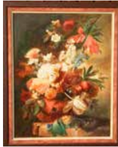
Blumenstrauss, 83x66 cm