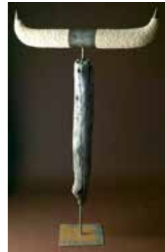
Horny Affair, 2017, 110x180 cm Natursteinzeug, Holz, Metall

Gemeinschaftsausstellung 22. bis 28. März 2019