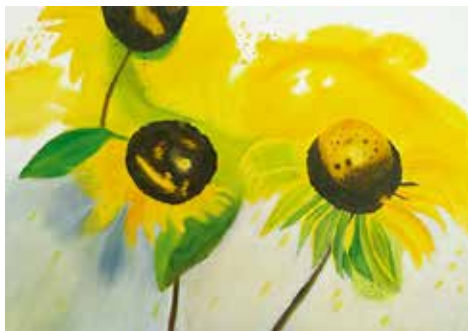
Drei Sonnenblumen, 2017, 90x60 cm