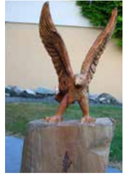
Adler, 2016, Linde, ca. 120 cm