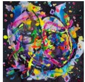
UNCOBA 35x35 cm