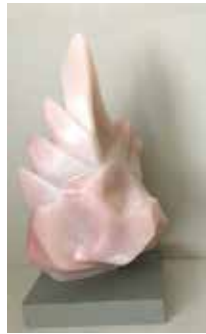
Flamme, 2018, Höhe 42 cm