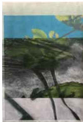
da-hinter 2, 89x60 cm