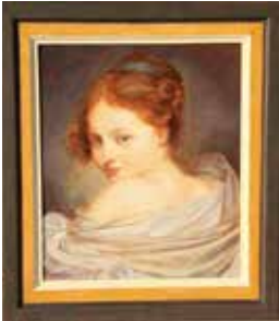
Mädchenportrait, 38x34 cm

Diverse Gruppenausstellungen in der Ostschweiz