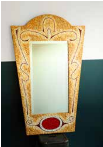
Spiegel, Mosaiksteine und Glas 128x78x3

Titel der Gemeinschaftsausstellung: «Mosaik, Acrylmalerei und Tuschezeichnung»