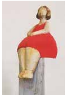
Sitzende Frau, 38x28x22 cm