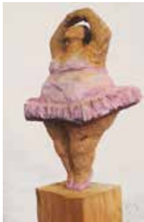
Ballettänzerin, Zedernholz mit Acryl bemalt, 110x38x25 cm

Titel der Ausstellung: «Holzskulpturen und abstrakte / gegenstandslose Malerei»