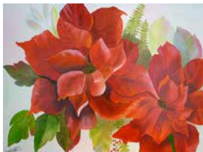
Weihnachtsstern, 2017, 80x60 cm