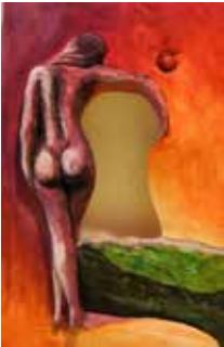
Frau, 2016, Relief, 20x30 cm

Titel der Ausstellung: «Eine Ausstellung zu zweien: Werke aus Holz - Objekte aus Stein»