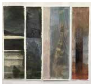
da-hinter 1, Serie, 60x13-22 cm (Streifen)

Diverse Einzel- und Gruppenausstellungen in der Schweiz