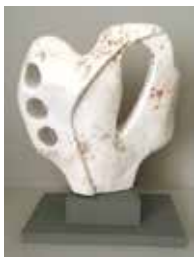
Wegmarke, 2018, Höhe 31 cm

Titel der Ausstellung: «Eine Ausstellung zu zweien: Werke aus Holz - Objekte aus Stein»