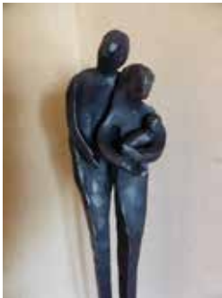
Heilige Familie, Stahl, roh geschmiedet, 120 cm