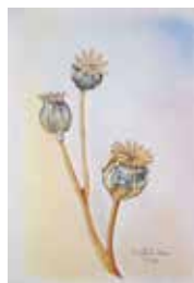
Mohnblumen, 20x30 cm, Farbstifte