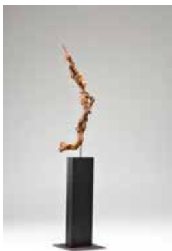
Innschwimmer, Schwemmholz auf Holz-Stahlsockel, 155 cm, 2015

Titel der Gemeinschaftsausstellung: Holz trifft Acryl