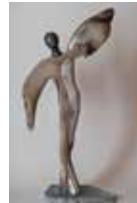
Raphaels Tanz, 59 cm