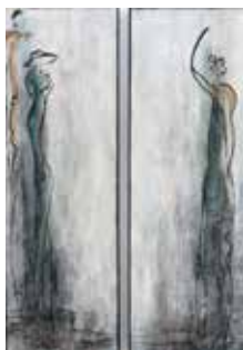
Encuentro, Acryl Mischtechnik 90x60 cm, 2017

Titel der Gemeinschaftsausstellung: Holz trifft Acryl