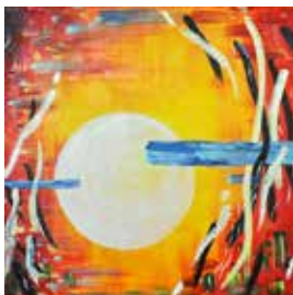
Hagel bei Sonnenuntergang Acryl, 60x60

Titel der Gemeinschaftsausstellung: Kunst hoch zwei