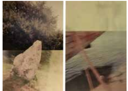
Stein und Schiff, Fotografie 2017

Gemeinschaftsausstellung 21. bis 23. September 2018