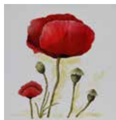
Mohn, Acryl auf Leinwand, 30x30, 2015