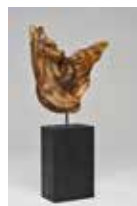
Güggel, Lärchenholz 47 cm, 2015