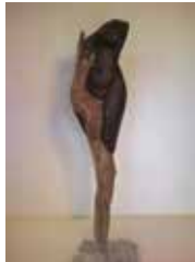
Demeter, 67 cm