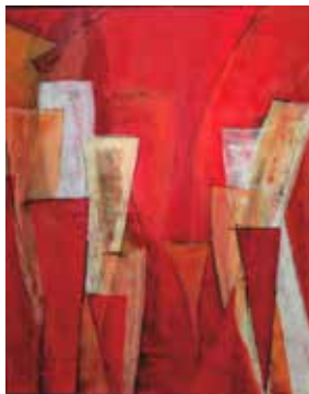
Festival, Acryl Mischtechnik 100x80 cm, 2015