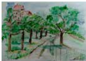
Altstätten (24 x 17 cm)