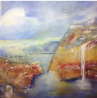
Lichtspiegelung, Öl/Acryl auf Leinwand, 80x80 cm