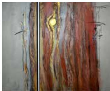
Zeitraum, Acryl Mischtechnik 120x100 cm, 2016

Gemeinschaftsausstellung 12. bis 14. Oktober 2018