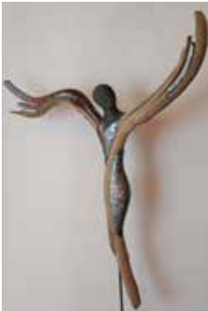
Ich bin bei dir, 110 cm

Titel der Ausstellung: Holz und Ton faszinierende Kombination