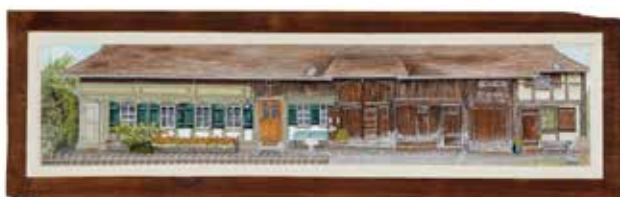
Albert Anker Haus, Acryl auf Holz, 85x26 cm, 2014

Titel der Gemeinschaftsausstellung: Kunst hoch zwei