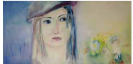
Frauenpower, Öl auf Leinwand, 50x100 cm