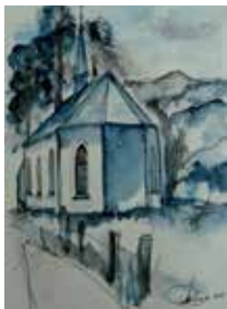
Forstkapelle (18x25 cm)

Gemeinschaftsausstellung: «In alle Richtungen...»