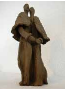
du und du, schwarzer Ton

Titel der Ausstellung: «Dialog der Kontraste»