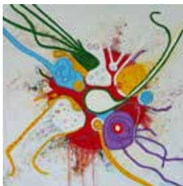
Moment Mischtechnik, 60x60 cm