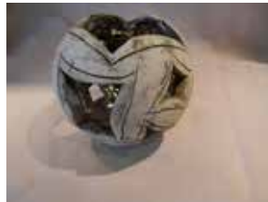
Lichtkugel, weisser Ton