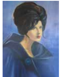
Violetta, Mischtechnik Acryl & Öl, 2013