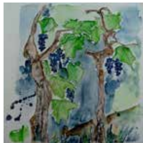
Reben (25x25 cm)

Gemeinschaftsausstellung 9. bis 11. Februar 2018