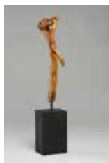
Bodybuilder, Wurzelholz 60 cm, 2014