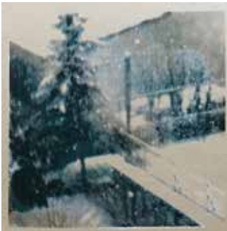
Winter, Siebdruck, 2015