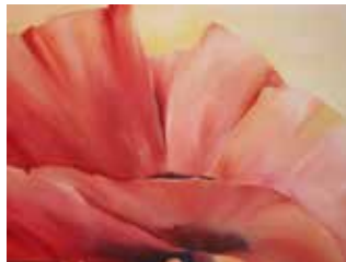
Türkischer Mohn, Öl, 2013