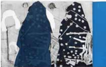
Radierung und Linoldruck

Titel der Gemeinschaftsausstellung: bildwelten