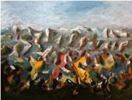
Spitzen, 2017 Öl auf Leinwand, 40x30 cm

Seit 1991 verschiedene Einzelschauen und Beteiligungen an Gruppenausstellungen. In vielen Sammlungen im In- und Ausland vertreten.