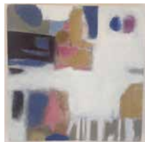
ohne Titel Acryl Mischtechnik, 30 x 30 cm