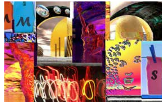
Bild: Völkerverbindung Unikat , Digital Art Painting, Plexiglas, 110 x 70 cm

weltweit wie Art Miami, Art Shanghai, Art Expo New York, 6th Goyang Festival Seoul sowie „10 Countries Exchange Exhibition of Art Professor“ zum Kulturaustausch Schweiz/Korea - oder Frauenmuseum Bonn und MOCA Museum of Contemporary Art in Beijing.