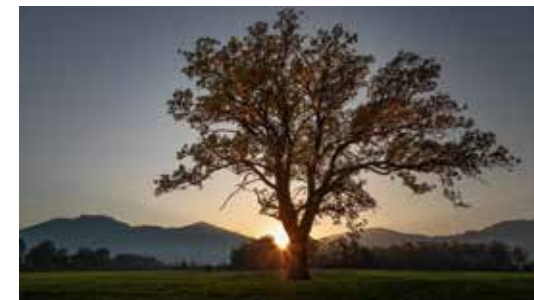
Sonnenuntergang im Bannriet