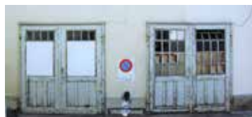
Tag und Nacht und sonntags, 2017 16x30 cm