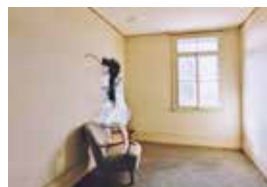
Der Kleiderbügel, 2015 16x22 cm