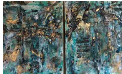
Lebensfreude, Mischtechnik 2x80x100 cm