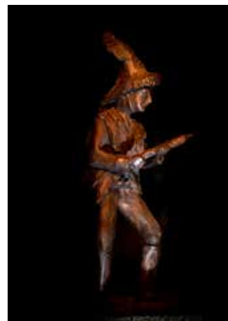
Röllelibutz, Bronze, 60 cm

In jungen Jahren Einzel- und Gruppenausstellungen sowie des Öfteren Teilnahme an Symposien. Seit mehr als 10 Jahren ist das die erste Ausstellung anlässlich seines abgeschlossenen 60. Altersjahr.