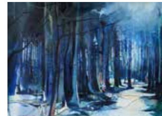
Blauer Wald, Aquarell 2018 48 x 66 cm, 2018