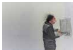
Freiraum 10.5x15 cm

Titel der Ausstellung: „Tag und Nacht und sonntags“