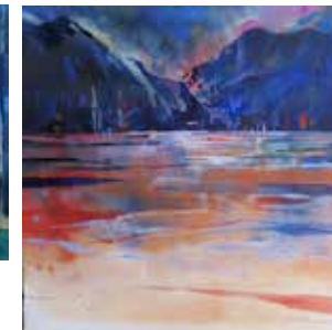
Comersee, Aquarell 60x60 cm, 2019