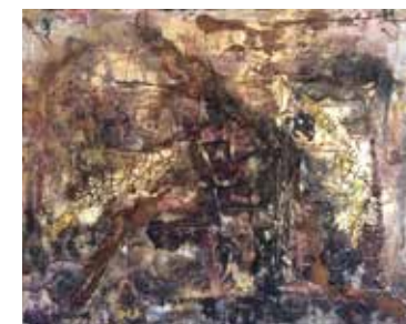
Spuren des Lebens, Mischtechnik, 80x100 cm