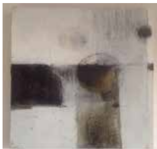
ohne Titel Acryl Mischtechnik, 30 x 30 cm