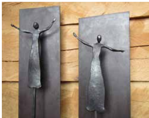
Engel, Stahl, roh geschmiedet, 150 cm