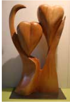
Harmonie, 2016, Linde, 50 cm