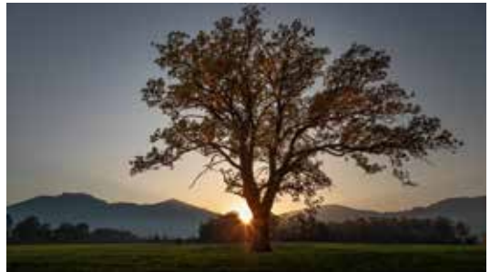
Sonnenuntergang im Bannriet