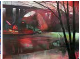
gespiegelte Brücke, Aquarell 47 x 62 cm, 2018