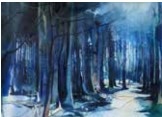
Blauer Wald, Aquarell 2018 48 x 66 cm, 2018