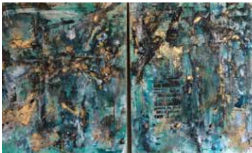
Lebensfreude, Mischtechnik 2x80x100 cm