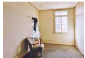
Freiraum 10.5x15 cm