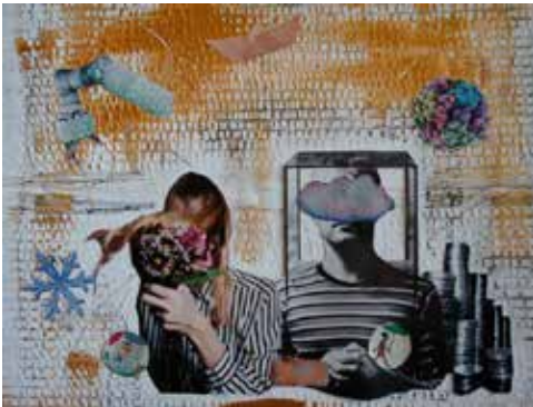
Zw'Einsamkeit / 2018, 70x70 cm

Titel der Ausstellung: „Geklebte Erinnerungen“