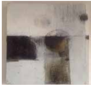
ohne Titel Acryl Mischtechnik, 30 x 30 cm