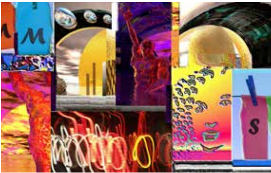
Bild: Völkerverbindung Unikat, Digital Art Painting, Plexiglas, 110 x 70 cm

Ausstellungen und Messen weltweit wie Art Miami, Art Shanghai, Art Expo New York, 6th Goyang Festival Seoul sowie „10 Countries Exchange Exhibition of Art Professor“ zum Kulturaustausch Schweiz/Korea - oder Frauenmuseum Bonn und MOCA Museum of Contemporary Art in Beijing.