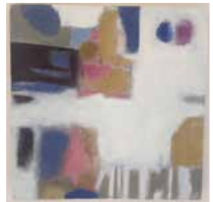
ohne Titel Acryl Mischtechnik, 30 x 30 cm