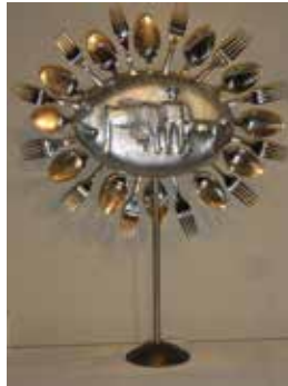
Monstranz-Heimat in mir