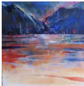
Comersee, Aquarell 60x60 cm, 2019