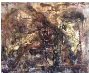
Spuren des Lebens, Mischtechnik, 80x100 cm