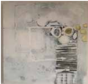
ohne Titel Acryl Mischtechnik, 30 x 30 cm

Diverse Ausstellungen in der näheren und weiteren Umgebung.