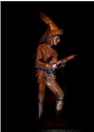
Röllelibutz, Bronze, 60 cm

Seit mehr als 10 Jahren ist das die erste Ausstellung anlässlich seines abgeschlossenen 60. Altersjahr.